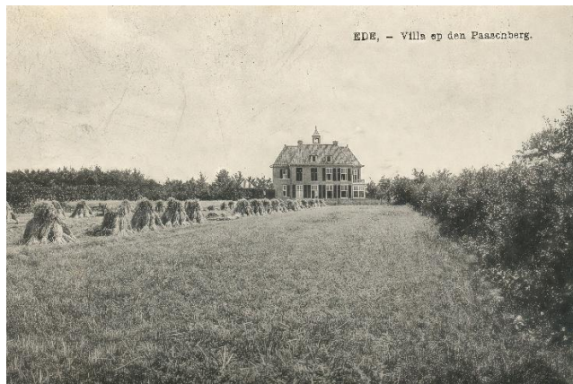
Ansichtkaart Ede - Villa op den Paaschberg