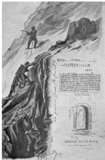
Illustratie uit dagboek Matterhorn

Van Eeghen schreef over deze onderneming een dagboek met illustraties, dat in 1952, veertien jaar na zijn overlijden, werd gepubliceerd. 13 Het duo kwam op 28 juni aan in Zermatt. Zij maakten eerst onder leiding van een lokale berggids twee oefentochten. 14 Daarna trokken zij, nu onder leiding van twee berggidsen, een week over de zogenaamde Haute Route Zermatt - Chamonix . Dat is een hoge alpiene route over gletsjers en hoge cols. Dit alles om goed geacclimatiseerd en geprepareerd te geraken. Uiteindelijk beklommen zij de Matterhorn vanuit Breuil-Cervinia in Italië op 7 en 8 juli 1881. Zowel voor Van Eeghen als voor Beels gingen per persoon twee berggidsen en een drager mee. De berggidsen waren onder andere Jean-Antoine Carrel en Jean Joseph Maquignaz, welke beiden in die tijd tot de absolute top behoorden. Leopold omschreef het dagboek van Van Eeghen over zijn Matterhorn beklimming: "geen bedachtzaamheid, geen diepe ernst, neen, een kleurrijk verhaal vol humor en zelfspot, een juweeltje in de Nederlandse alpiene literatuur". 15 Niet alleen een 'saai piet' dus deze Van Eeghen, maar tegelijk een enthousiaste avonturier.